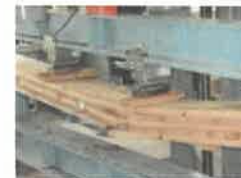
部材のデータ収集