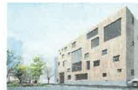
CLTを活用した街作りの実証