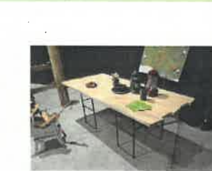
顔の見える木材を使用した構造材・家具等の普及啓発