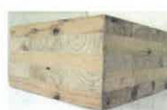
木質建築資材の開発