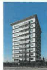
都市の木造化に向けた取組